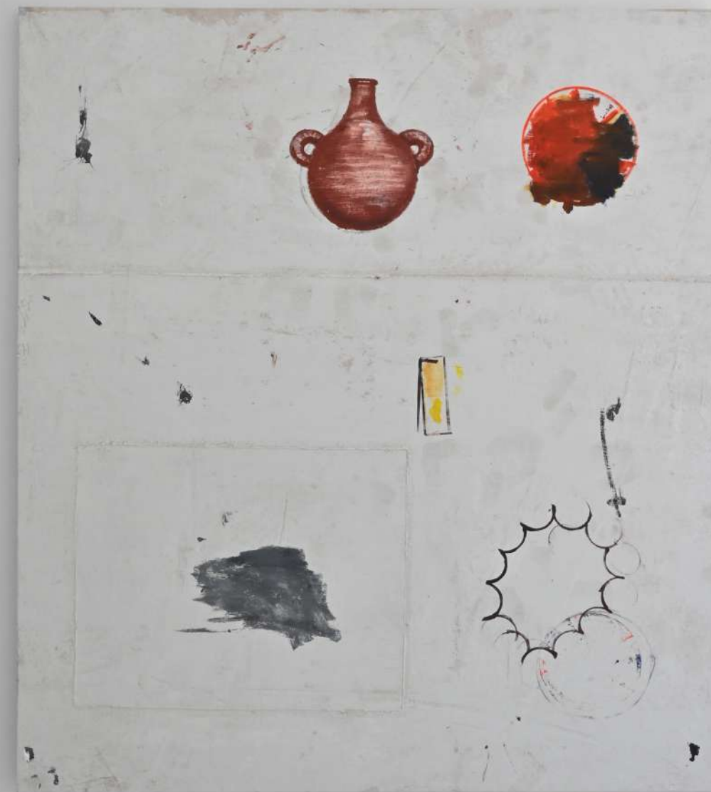
Eloy Arribas Mesa 2 , 2023 Monotipo acrílico, cera y óleo sobre lienzo 150 x 130 cm