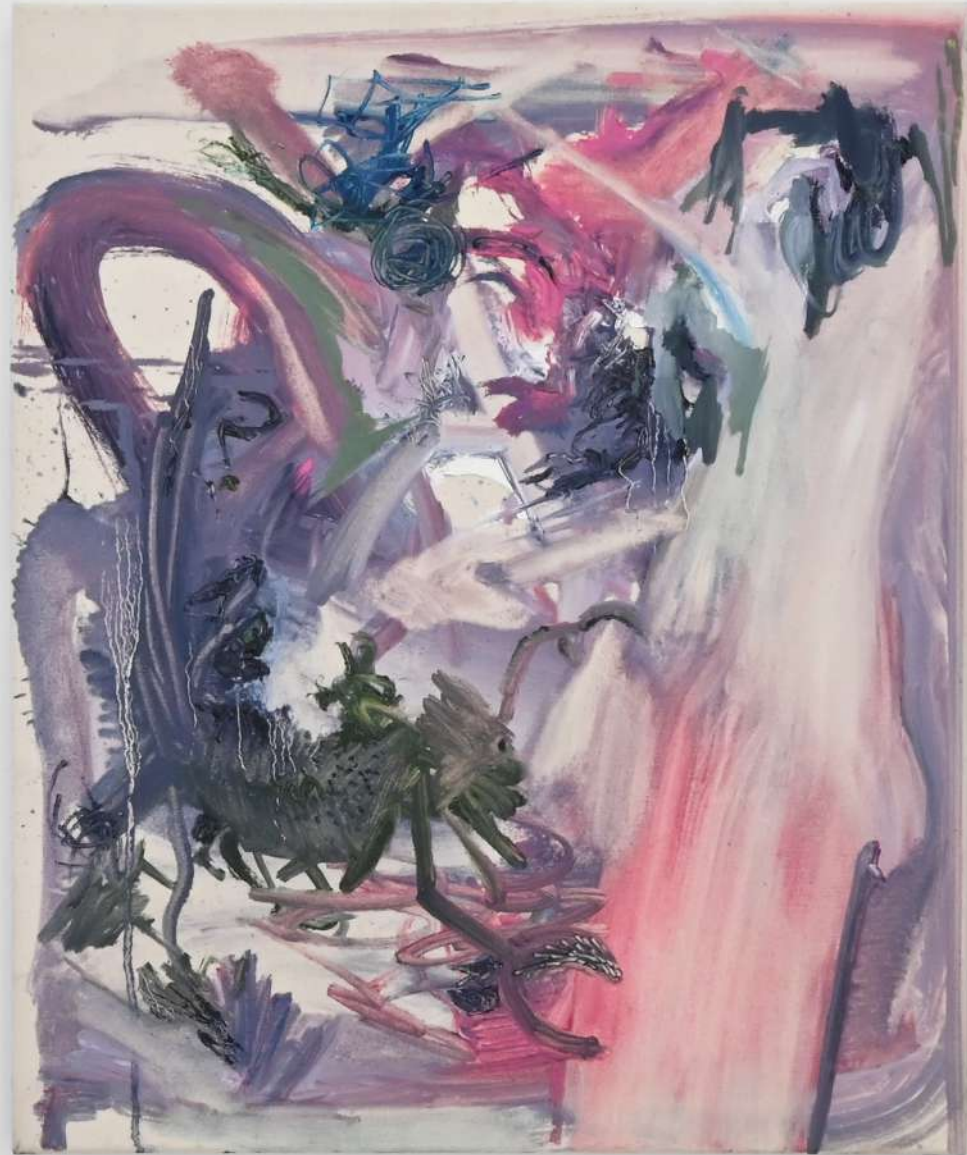
Jesús Crespo Hiding Place , 2021 Óleo sobre resina vinílica sobre tela 60 x 50 cm