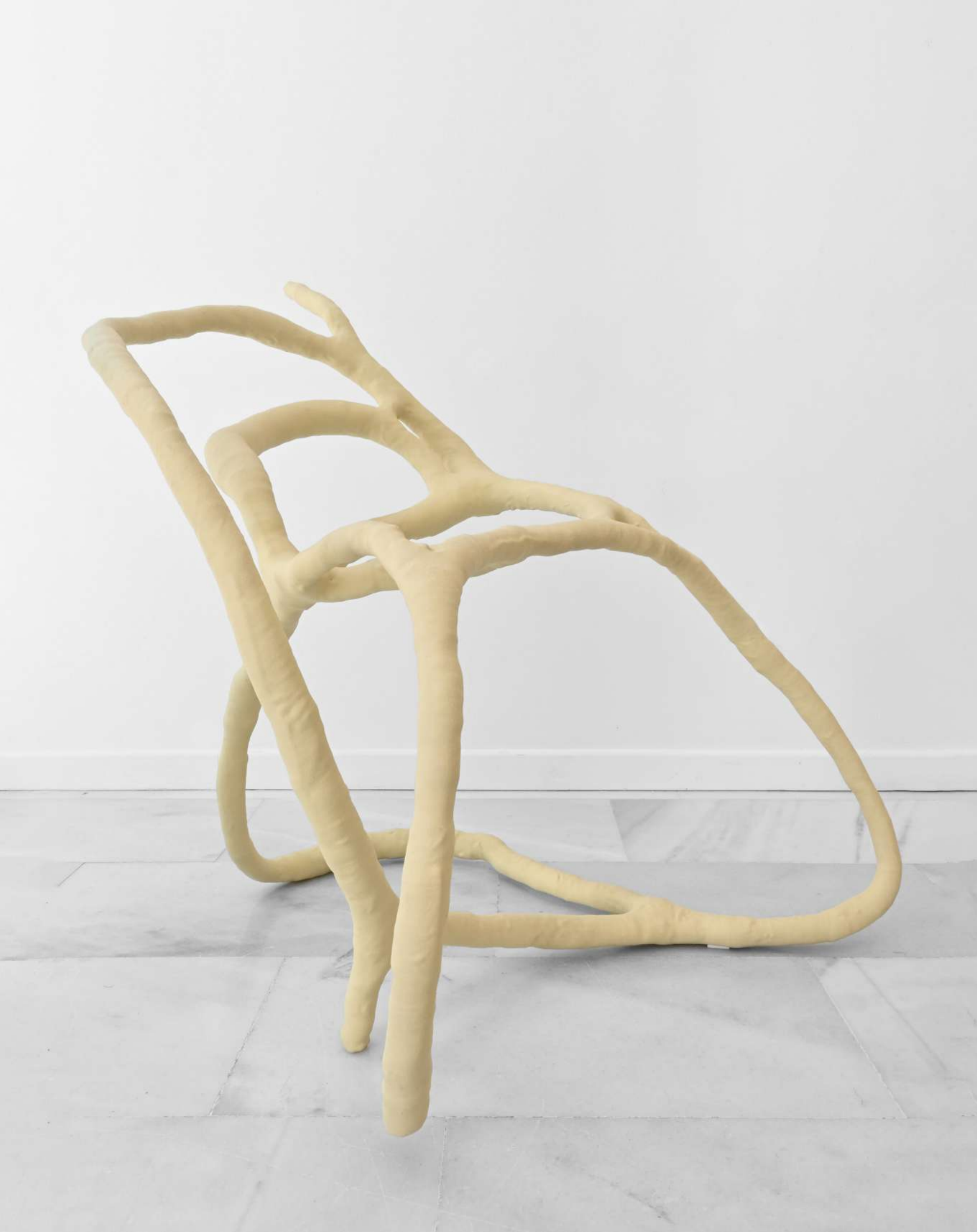
Alejandro Cerón Beautiful Mess n. 2, 2023 Acero, poliuretano y espuma de PU. 72 x 90 x 86